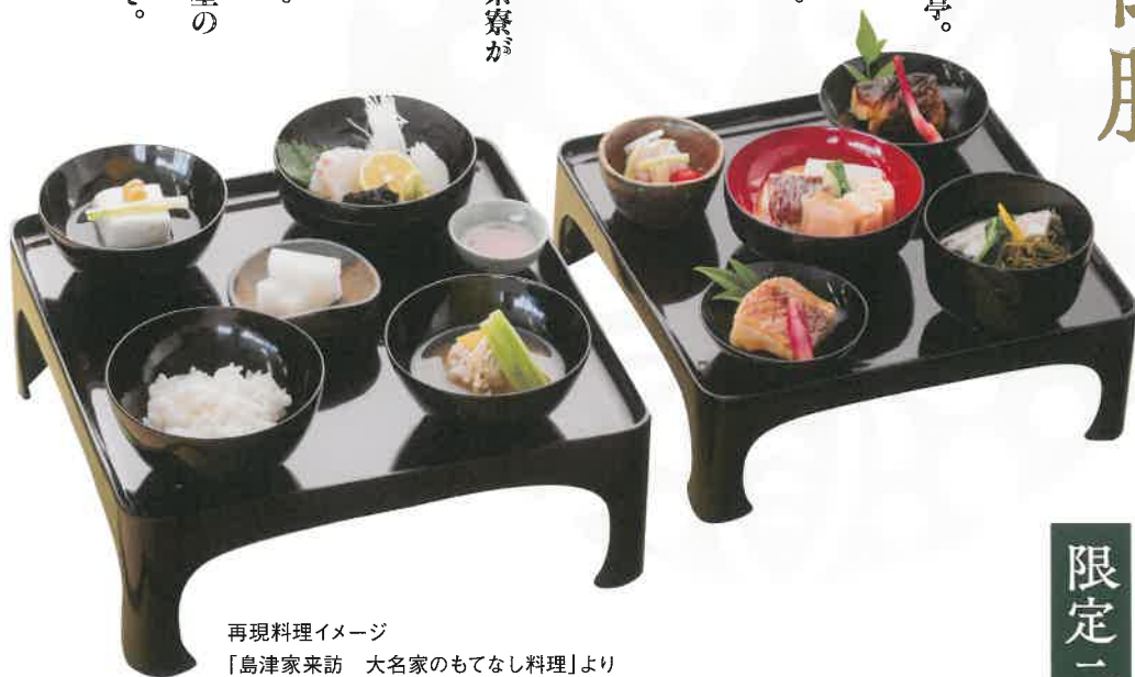
再現料理イメージ