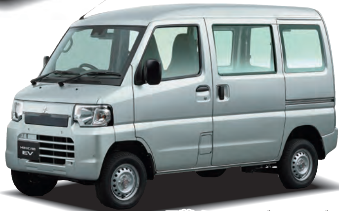
三菱 ミニキャブ・ミーブ