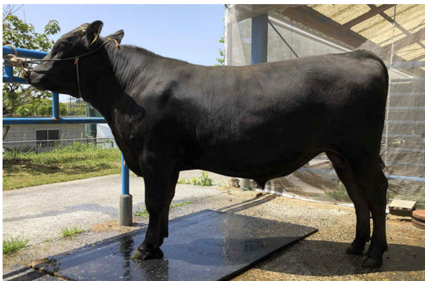
福之勝糸 (福之姫 - 勝忠平 - 糸藤)