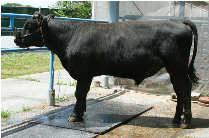
美恵晴花 (美恵茂 - 茂晴花 - 安福久)