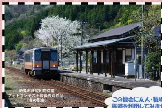
新見市鉄道利用促進 フォトコンテスト最優秀作品 「春の駅舎」