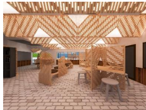
シン・駅舎空間のイメージ