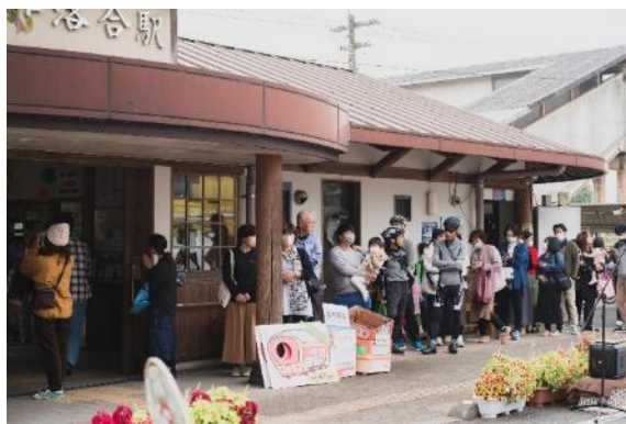
美作落合駅の賑わい

姫新線を市民共有の財産・地域資源と位置付け、地域の多彩な関係者とともに危機感の共有や利用意識の醸成につながるイベントを実施