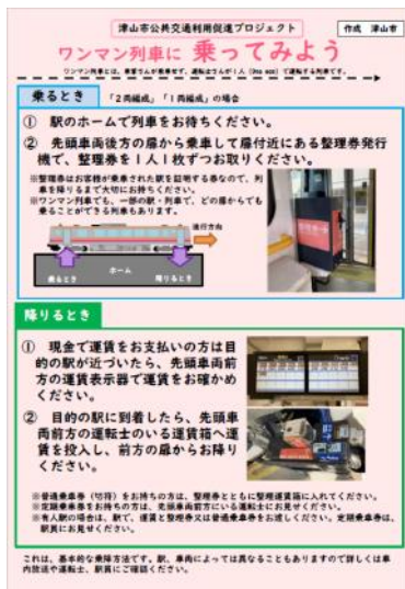
公共交通乗り方教室 配布資料