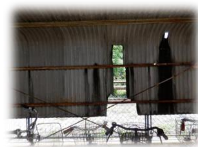
老朽化した久世駅駐輪場