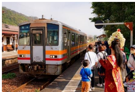
姫新線に乗って会場を巡る