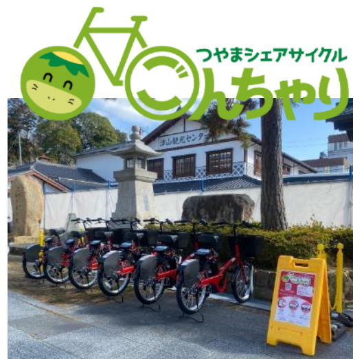
つやまシェアサイクル 「ごんちやり」