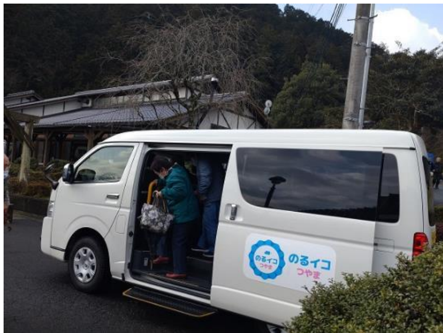
「のるイコつやま」 利用風景

二次交通としての利用を促進する観点から、J R の駅で乗降した場合、「のるイコつやま」の利用料から100円を割引く制度を導入している。