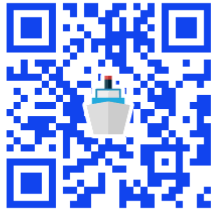
「マリンドローン」のサイト (外部)に移動します