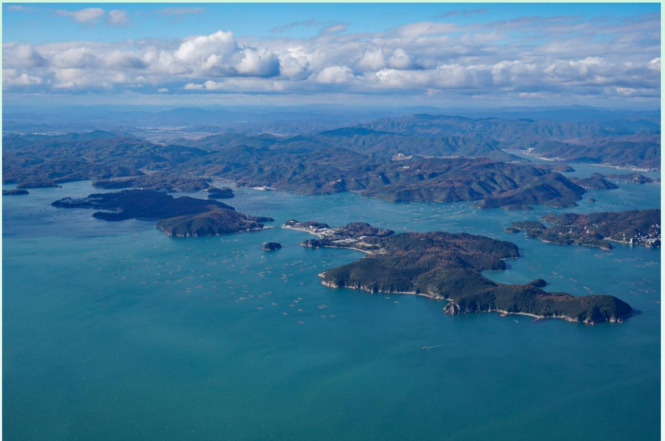
長島空撮