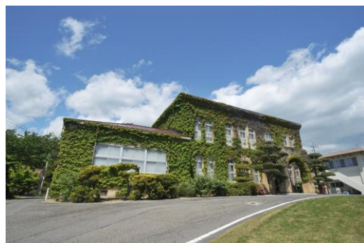
長島愛生園歴史館

長島愛生園は、 岡山 県 瀬戸内 市にある、国立の療養所で、 1930 (昭和 5 ) 年に発足しました。当時、感染症である ハンセン 病に有効な治療薬がなく、国は、患者を療養所に強制的に 隔離 する政策を取りました。1946(昭和21)年頃から特効薬を使用し始め、その後も有効な薬が開発され、早期に発見し、適切に治療することによって、この病気は治る病気となりました。しかし、この政策の根拠となる1953(昭和28)年に制定された らい予防 法は1996(平成8)年まで継続し、治った患者に対しても、恐ろしい感染症患者であるという間違ったイメージが植え付けられ、偏見や差別を助長することになりました。