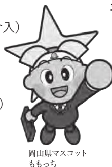
岡山県マスコット もち