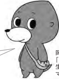
岡山県 「ばっちり!モグモグ」 生活リズム向上 マスコットキャラクター