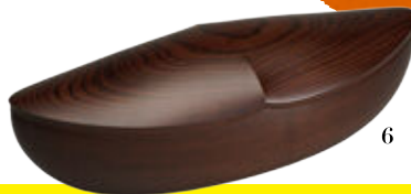
1 日本工芸会奨励賞 友禅着物「汽水城」尾崎久乃 2 日本工芸会保持者賞 銀泥彩磁鬼灯文鉢 井戸川豊 3 日本工芸会会長賞 七宝鉢「律」安藤令子 4 日本工芸会奨励賞 漆絵箱「盛夏」田中義光 5 日本工芸会新人賞 布目象眼五角鉢「滯」藤川耕生 6 日本工芸会新人賞 櫻拭漆蓋物「夕映鯨」松原輝