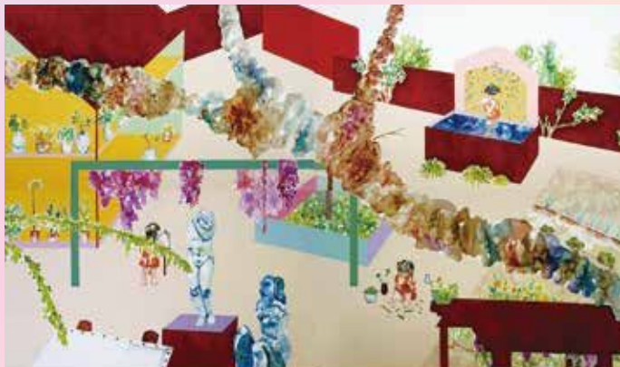
《イブとヴィーナス》2024