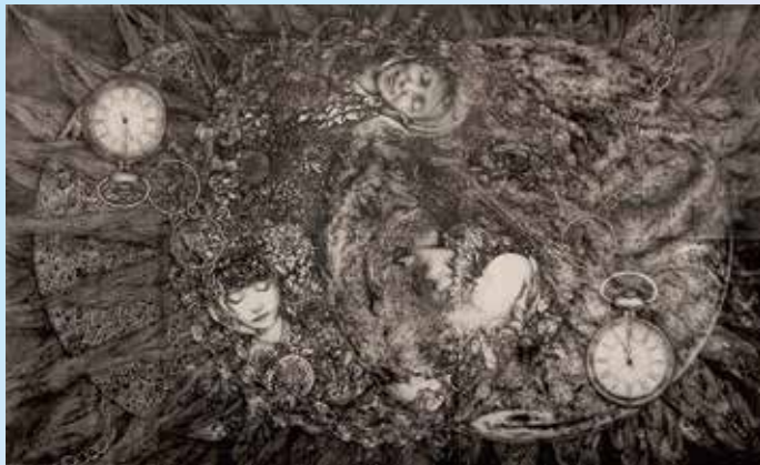
《生命の変容と融合-0への帰帰-》2024