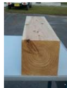
目標とする乾燥状態

スギ柱材の「複合式乾燥法（熱風加熱、高周波加熱、減圧を複合的に組み合わせた）」に関するこれまでの試験結果を総括し、実用的なガイドラインマニュアルを作成した。製材業界を対象とする実務研修を行い、複合乾燥技術の普及に努めた。