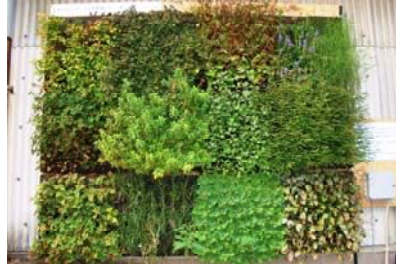
壁面緑化実証試験