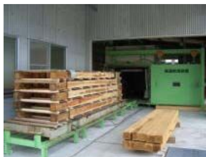
複合乾燥装置の外観

【成果】オープンラボ施設を用いて、スギ柱材の複合式乾燥試験（熱風加熱、高周波加熱、減圧を複合的に組み合わせた）を行い、スギ柱材（芯持ち・背割りなし）を、内部割れ、変色を抑えながら、材面割れの発生率を30%程度まで減少させることができた。高品質乾燥材生産に向けた成功率を、70%程度まで高めることができた。