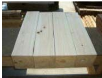
開発した複合乾燥による仕上がり (変色や内部割れが少ない)