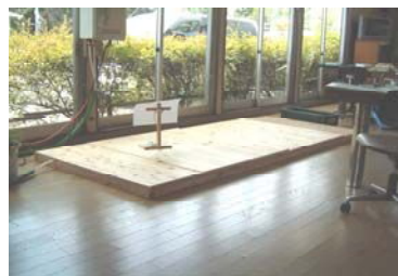
木材販売事務所内