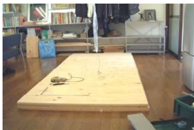
建築設計事務所内

【成果】フローリング材の乾縮に伴う隙間の発生と抑制および膨潤に伴う浮き上がりの発生と抑制、仕上げ含水率と材幅など品質の指針となる知見を得た。