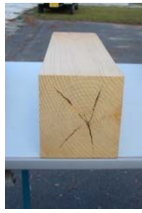
高温乾燥による仕上がり (内部割れが発生する)