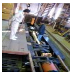
台形集成材の実大引張試験