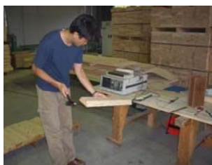
台形ラミナのヤング係数測定

【成果】得られた台形ラミナの強度性能データ、構造用台形集成材の製造方法、製造した集成材の実大試験によるせん断・めり込み強度のデータ等は2007年の集成材JAS改正作業の基礎データとして使用され、低質間伐材による構造用集成材の製造を可能にした。