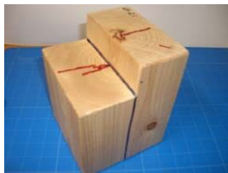
椅子型せん断試験材