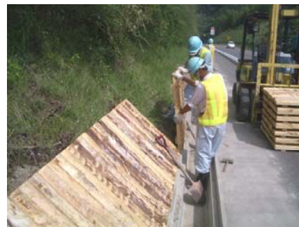
法面被覆パネル施工状況 (真庭市豊栄 国道313号)