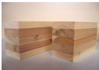
異樹種複合集成材：

【成果】スギ、ヒノキ、オウシュウアカマツ、ダフリカカラマツを組み合わせた異樹種複合集成材を試作し、JASに準じて接着耐久性評価試験を実施した。異樹種ラミナの剥離は適切な接着剤の選定等により抑制できることがわかった。