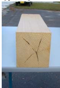
既存の高温乾燥による仕上がり (変色し、内部割れが発生する)

ヒノキ柱材の複合乾燥（熱風減圧乾燥）を行い、材面割れ、内部割れ、変色を抑制できる乾燥条件を見出した。これらのデータをもとに、製材業界を対象とする実務者研修会を開催し、普及に努めた。