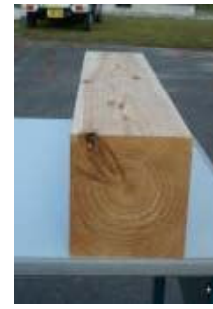
複合乾燥による仕上がり (内部割れや変色が少ない)

ヒノキ柱材の複合乾燥（熱風減圧乾燥）を行い、材面割れ、内部割れ、変色を抑制できる乾燥条件を見出した。これらのデータをもとに、製材業界を対象とする実務者研修会を開催し、普及に努めた。