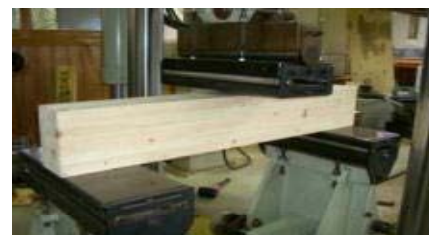
台形集成材の実大せん断試験