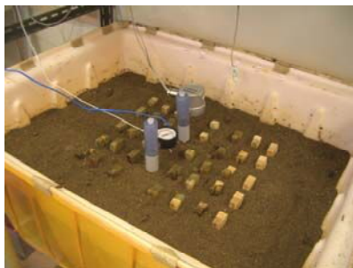
木材腐朽促進試験

【成果】薬剤処理材の養生条件（温度と時間）及び乾燥条件を変えて溶脱試験を行い、薬剤の定着性が向上する最適な処理条件が得られた。また、屋外暴露試験により、保存処理材の割れの発生要因を明らかにした。