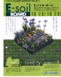
製品パンフレット