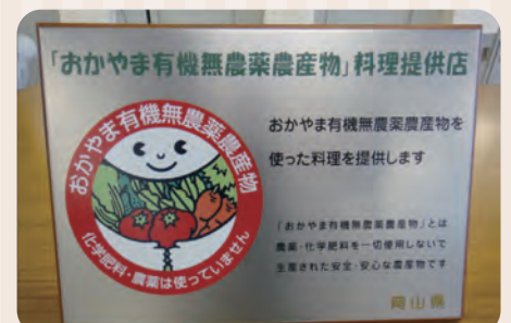
料理提供店プレート