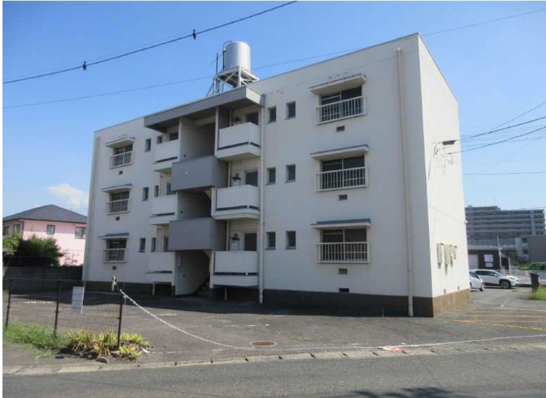
②ポンプ室（南西側より撮影）