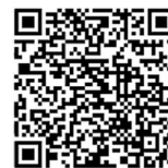
早島支援学校デジタルフェス参加申込フォーム

*参集開催(1日・午前のみ・午後のみ)またはオンライン(午後のみ)による参加が可能です。