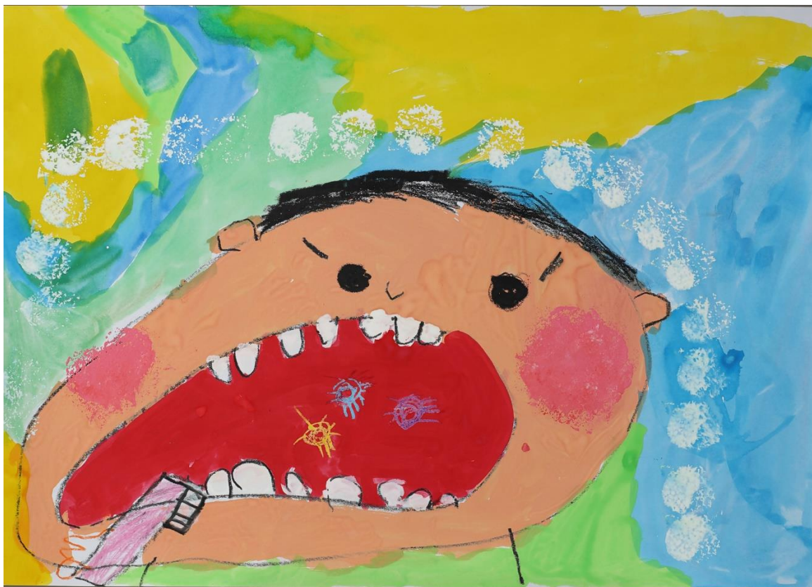
新見市立哲西認定こども園 山本 桜愛 (やまもと さえ)