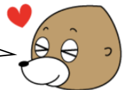
「ぼっちり！モグモグ」 岡山県生活リズム向上マスコットキャラクター

講師が企業等を訪問し、家庭教育支援に関する出前講座を実施し、ワークショップや講義を通して家庭教育の重要性を考えていただく事業です。※別添資料あり