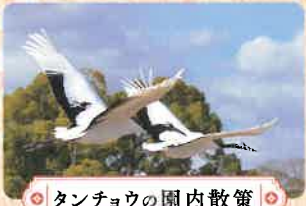
タンチョウの園内散策