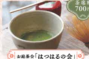
お庭茶会「はつはるの会」