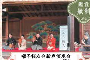
囃子桜友会新春演奏会 「文化は平和の源」