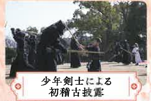
少年剣士による 初稽古披露

●時間/9:00~16:00 今年の己の野望を打ち立て、天守前に貼り出すのじゃ! 大願成就是岡山城から!