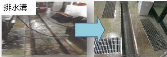
施設の衛生管理の強化に向けた排水溝、床、壁等の改修