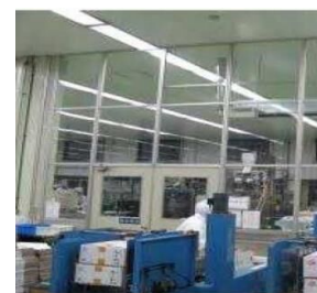
空気を經由した汚染を防止する設備（パーティション）の導入