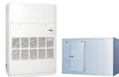
厳密な温度管理に対応する急速冷凍庫等の導入