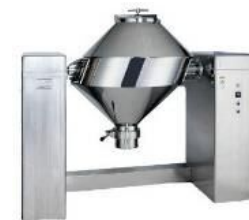
製造ラインにおいて添加物混入を回避する輸出専用ミキサーの導入