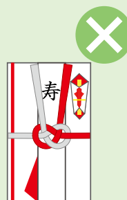
結婚祝*、香典*、卒業祝、入学祝など