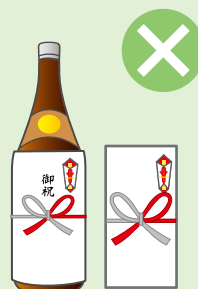
お祭りへの寄附・差し入れ、町内会の集会・旅行などの催物への寸志・飲食物の差し入れ

※政治家本人が結婚披露宴、葬式などに自ら出席してその場で行う場合には、罰則が適用されない場合があります。