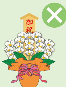
落成式・開店祝などの祝花、葬儀の供花、病見舞いなど