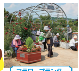
フラワープランター