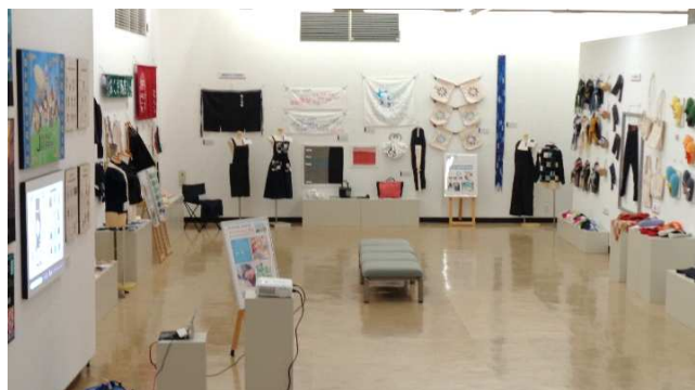
倉敷工業高校 テキスタイル工学科