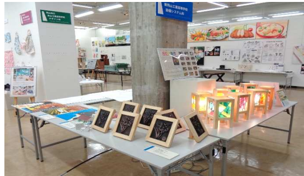
東岡山工業高校 設備システム科