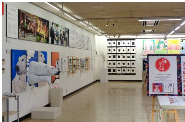
岡山工業高校 デザイン科