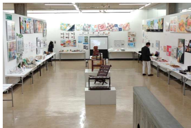
津山工業高校 デザイン科