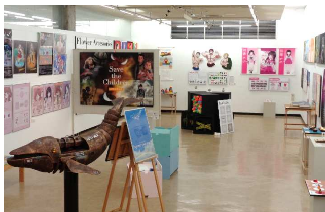
高梁城南高校 デザイン科