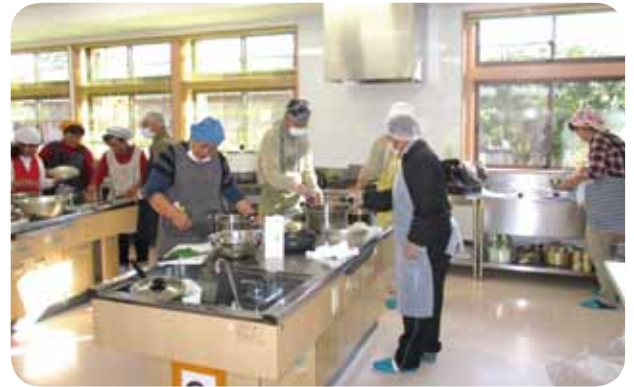
第6回講座 地球にやさしい暮らしのヒント (エコクッキング)

この事業は、3年間の継続事業として取り組まれますので、3年の間に井原市環境マイスターに認定された多くの方々とともに、環境活動への取り組みが広がることを期待しています。