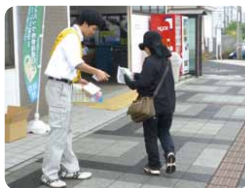
マイバッグの配布