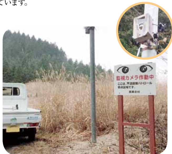
監視カメラ設置の様子

監視カメラ頼みになるのも考えものですが、暫くは不法投棄をさせない抑止効果として監視カメラに期待しています。