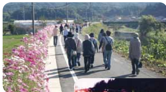
コスモス ウォーキング(10月)

自分たちにとって住みよいまちになることはもちろん、真庭市の「南の玄関口」として、訪れた方にも良い印象を持っていただけるよう今後も地域全体できれいなまちづくりに取り組んでいきます。