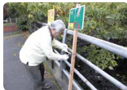
不法投棄看板の設置