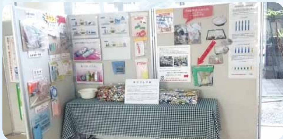
備中地域局で展示 「ごみの分別コーナー」

この広報誌は“ふるさとをきれいに する運動”を推進するために 配布しております。