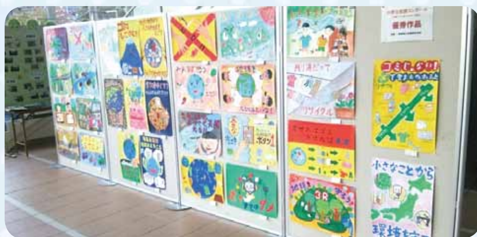
有漢地域局で展示 「小学生絵画コンクール」