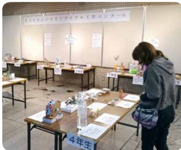
今年度の展示の様子 (岡山市役所1F市民ホール)

岡山市でも平成24年3月に改訂した一般廃棄物（ごみ）処理基本計画で環境教育の充実を基本方針の一つにあげており、当協議会でも引き続き継続していきたいと考えています。