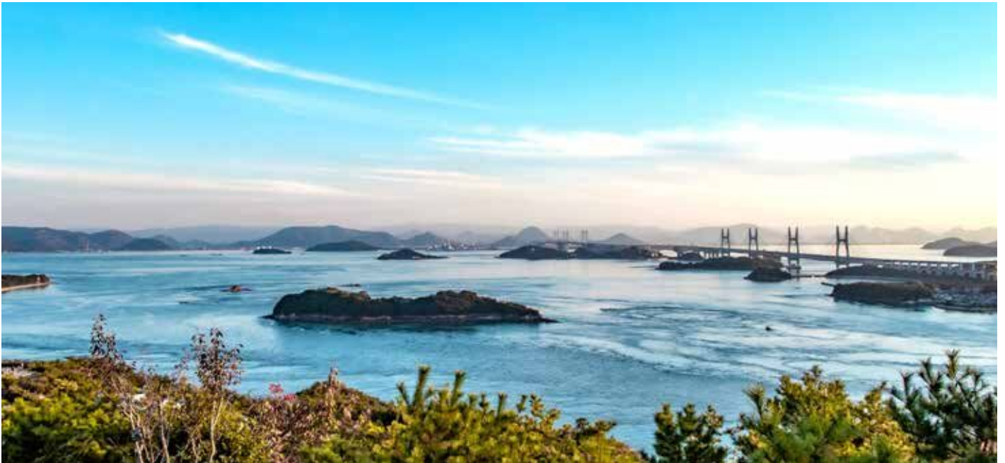
鷲羽山から望む瀬戸内海

この広報誌は“ふるさとをきれいに する運動”を推進するために 配布しております。