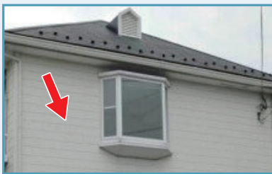
窯業系サイディング