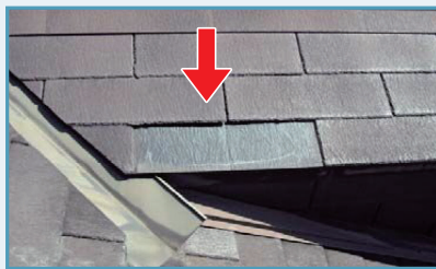
住宅屋根用化粧スレート