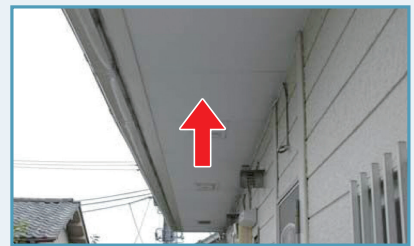
けい酸カルシウム板第1種