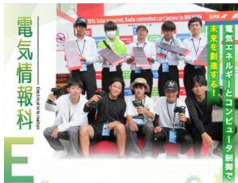
本校電気情報科の紹介