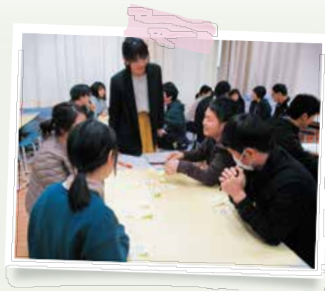
働き方改革研修会の様子