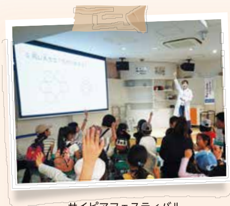
サイピアフェスティバル