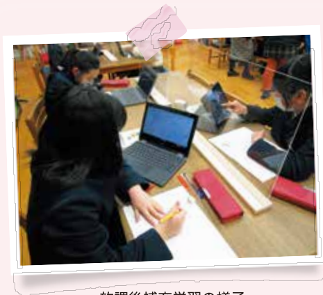
放課後補充学習の様子