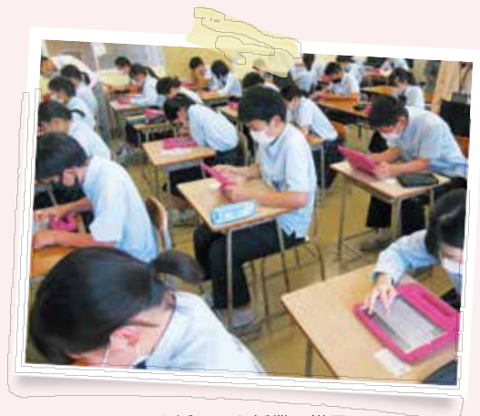
ICTを活用した授業の様子