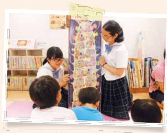
高校生による読み聞かせ