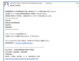
※実際の画面とは異なる場合があります

皆さまからの報告を起点に、厚生労働省、PMDA、製造販売業者など、医療にかかわる人たちが報告情報を活用することで、日本の医療を支えています。