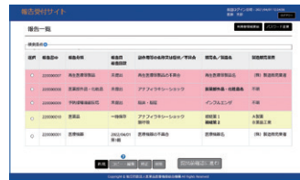
◀報告書登録済みの場合