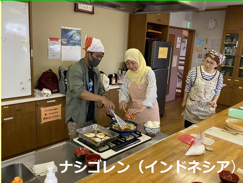
ナシゴレン (インドネシア)