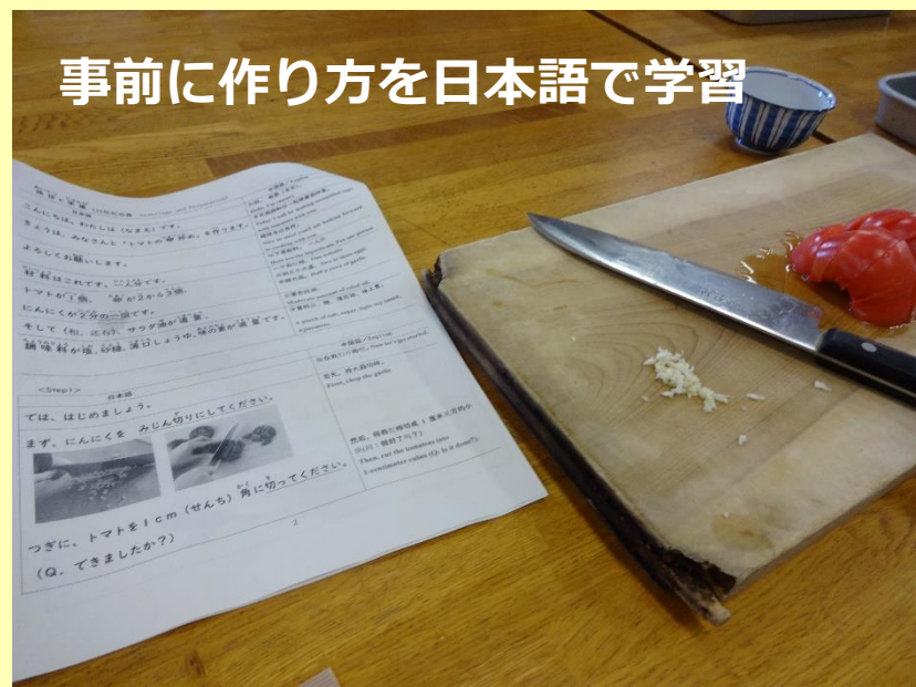
事前に作り方を日本語で学習