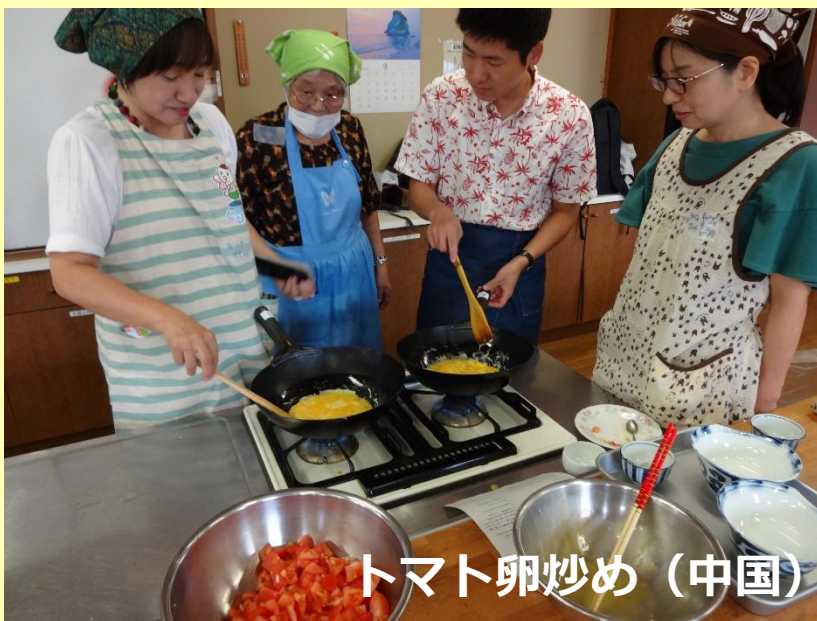
トマト卵炒め (中国)