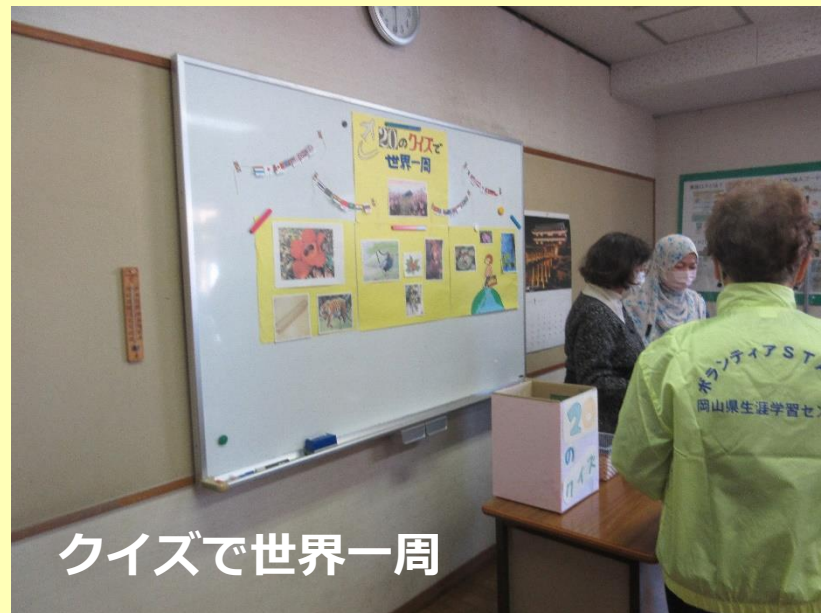
クイズで世界一周