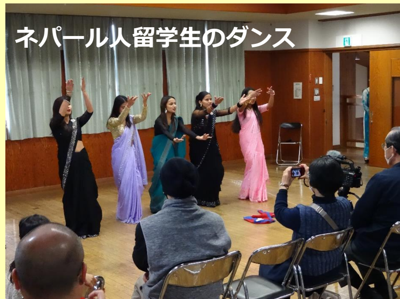
ネパール人留学生のダンス