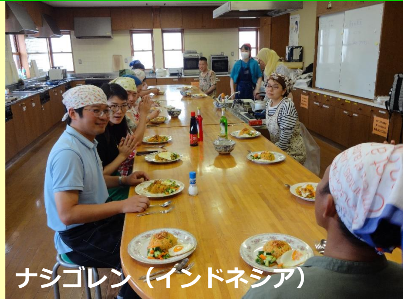
ナシゴレン (インドネシア)