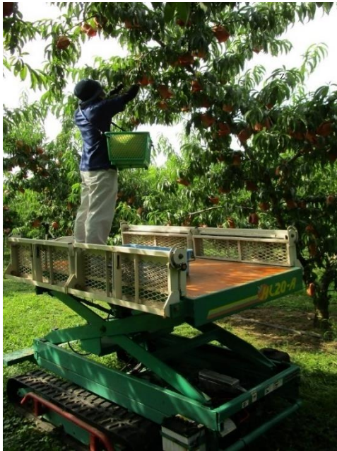
図1 垂直昇降型の高所作業機を用いた予備摘果作業の様子