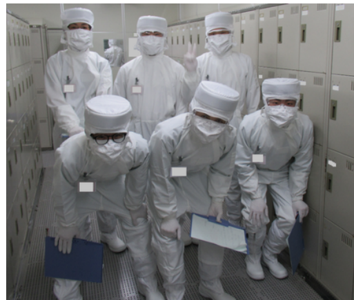
企業と連携した活動の様子

※）笠工型デュアルシステム：学校や連携協定を組んだ大学で座学を実施し、地元企業で実習を実施することで、学びながら仕事への実践的な知識や経験を養うための活動。